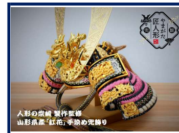
人形の装飾 製作監修 山形県産「紅花」手染め兜飾り