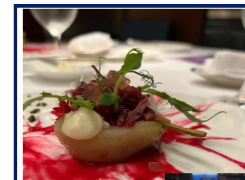
↑電害を受けたラ・フランス 果肉には影響なし