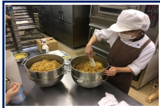
カットしたリンゴをシロップと混ぜ合わせます