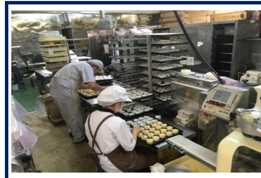
リンゴと生地を機械で形成後チェック