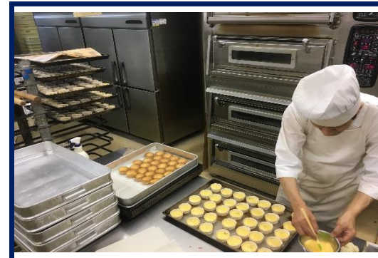
焼き色を付けるため卵を塗っています